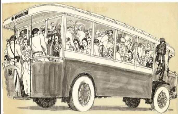
L'autobus, Cabu, 1967. Plume, stylo isographique, encre de Chine sur papier coté sur calque, 28x45. Publié dans « Le nouveau Canicône » (1969) - VERMOREL CHENET

Exposition. À l'occasion des 80 ans de ce tragique événement, le mémorial de la Shoah expose, pour la première fois, une série de croquis du dessinateur.